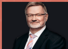
Ango Winther Aarhus Kommune